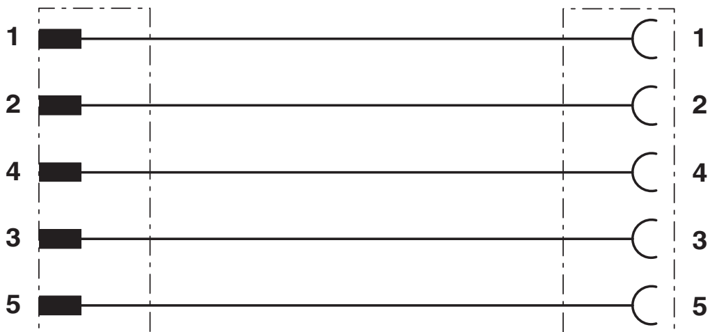
Kontaktbelegung des M12-Stecker und der M12-Buchse