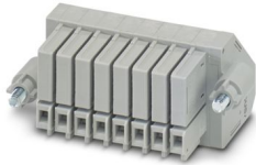
Abbildung zeigt 8-polige Variante.

Stecker für fünf Stromwandler, mit jeweils voreilendem Wandlerkurzschluss