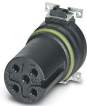
Abbildung zeigt Standardartikel

Bitte beachten Sie, dass die in diesem PDF-Dokument angezeigten Daten aus unserem Online-Katalog generiert wurden. Bitte finden Sie die vollständigen Daten in der Benutzer-Dokumentation. Es gelten unsere Allgemeinen Nutzungsbedingungen für Downloads.