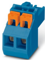
La figura muestra el artículo estándar sin impresión

Conector de placa de circuito impreso, sección nominal: 2,5 mm 2 , color: negro, corriente nominal: 16 A, tensión nominal (III/2): 300 V, superficie de contacto: Sn, tipo de conexión del contacto: Hembra, número de potenciales: 2, número de filas: 1, número de polos: 2, número de conexiones: 2, familia de artículos: PSPT 2,5/..-ST, paso: 5 mm, tipo de conexión: Conexión por resorte push-in, dirección de conexión conductor/placa de circuito impreso: 0 °, gancho de sujeción: - Gancho de sujeción, sistema enchufable: COMBICON MSTB 2,5 advanced, bloqueo: sin, tipo de sujeción: sin, tipo de embalaje: empaquetado en caja, Variante con codificación e impresión