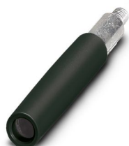
Prüfsteckerbuchse, Polzahl: 1, Farbe: schwarz

Bitte beachten Sie, dass die in diesem PDF-Dokument angezeigten Daten aus unserem Online-Katalog generiert wurden. Bitte finden Sie die vollständigen Daten in der Benutzer-Dokumentation. Es gelten unsere Allgemeinen Nutzungsbedingungen für Downloads.